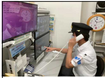
神戸電鉄 鈴蘭台駅