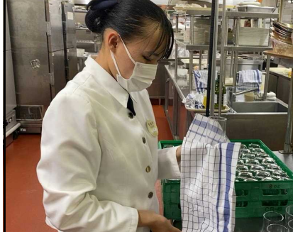
ホテルオークラ神戸