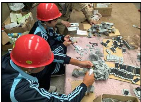
T S エンジニアリング

二学年の就職志望生徒を対象に、7月25.26日を中心とした2日間、それぞれの志望する職種・業種で実施しました。