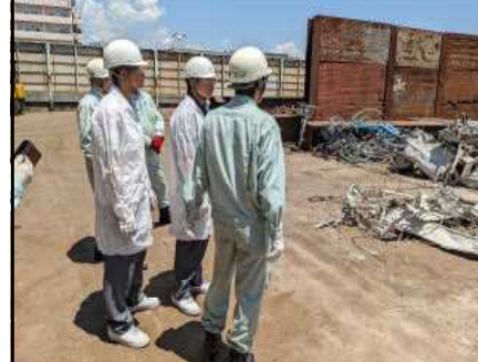
シマブン・コーポレーション