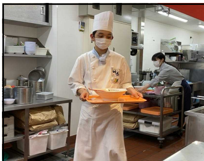
どうとんぼり神座