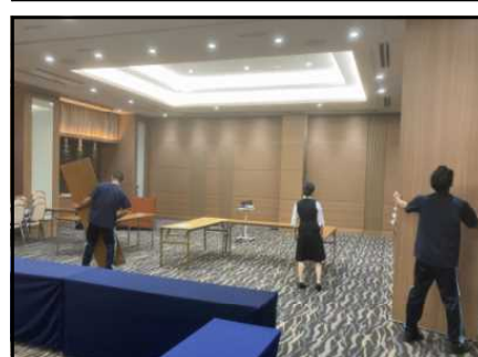
ホテル・ビナリオ梅田